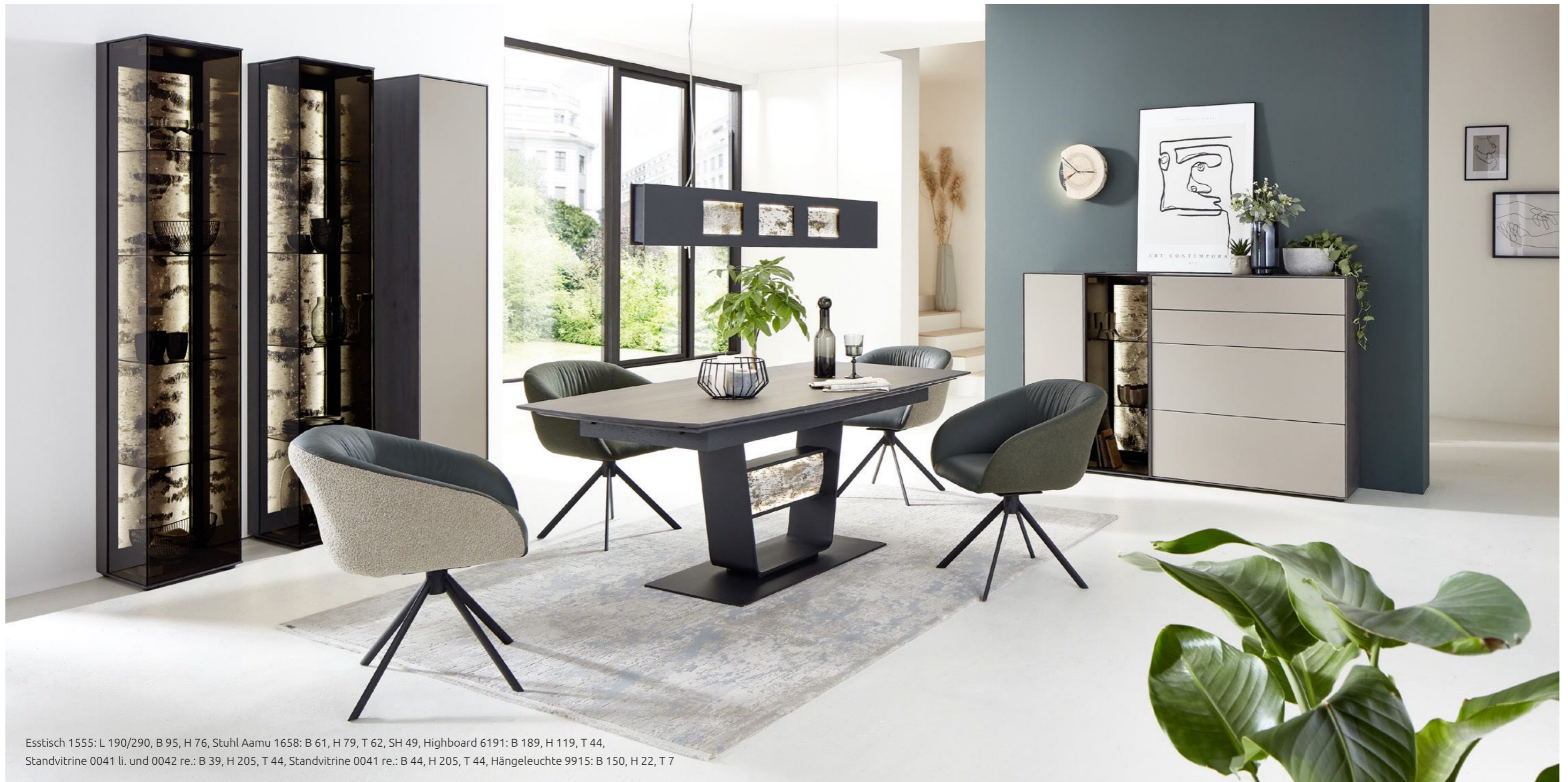
Esstisch 1555: L 190/290, B 95, H 76, Stuhl Aamu 1658: B 61, H 79, T 62, SH 49, Highboard 6191: B 189, H 119, T 44, Standvitrine 0041 li. und 0042 re.: B 39, H 205, T 44, Standvitrine 0041 re.: B 44, H 205, T 44, Hängeleuchte 9915: B 150, H 22, T 7