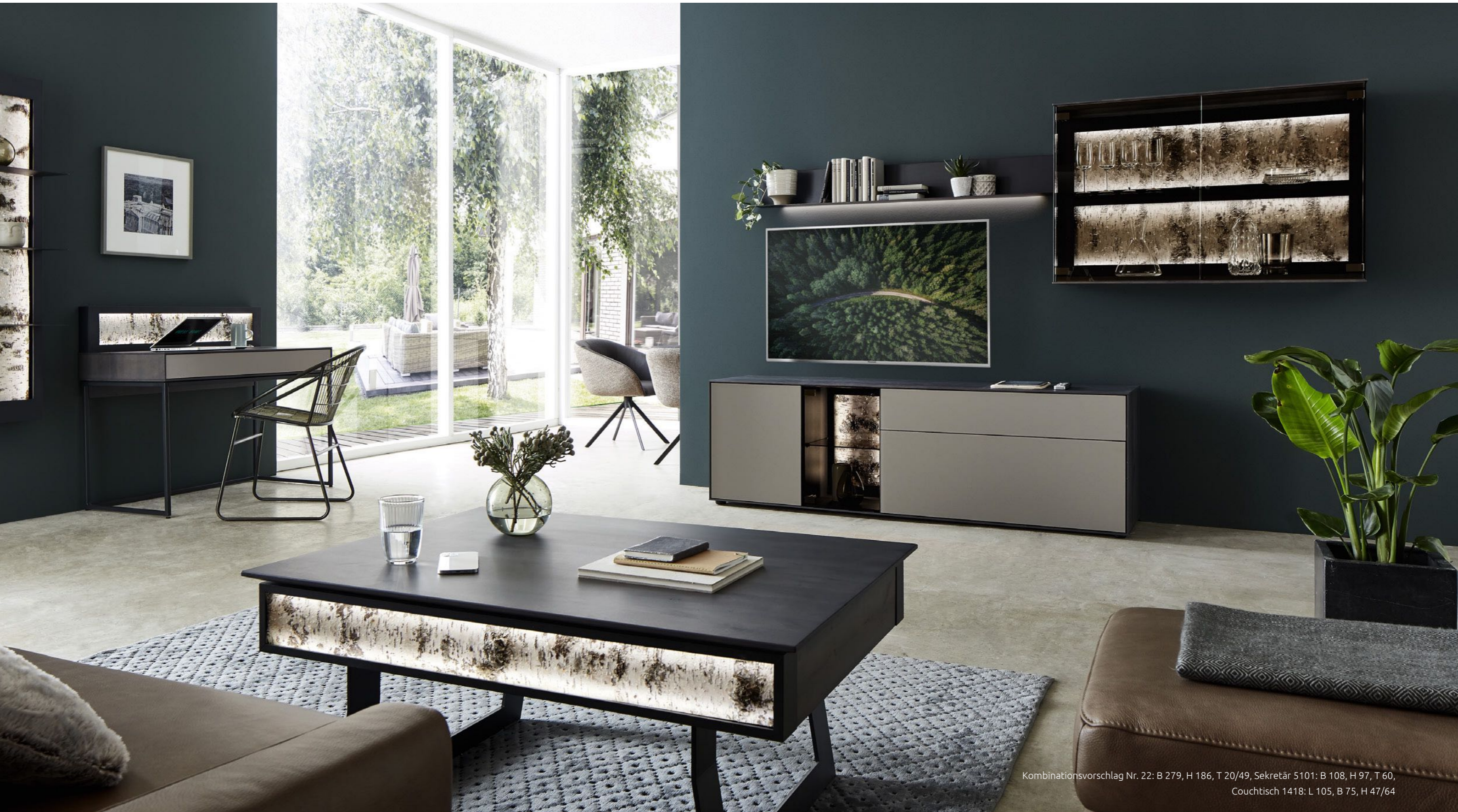
Kombinationsvorschlag Nr. 22: B 279, H 186, T 20/49, Sekretär 5101: B 108, H 97, T 60, Couchtisch 1418: L 105, B 75, H 47/64