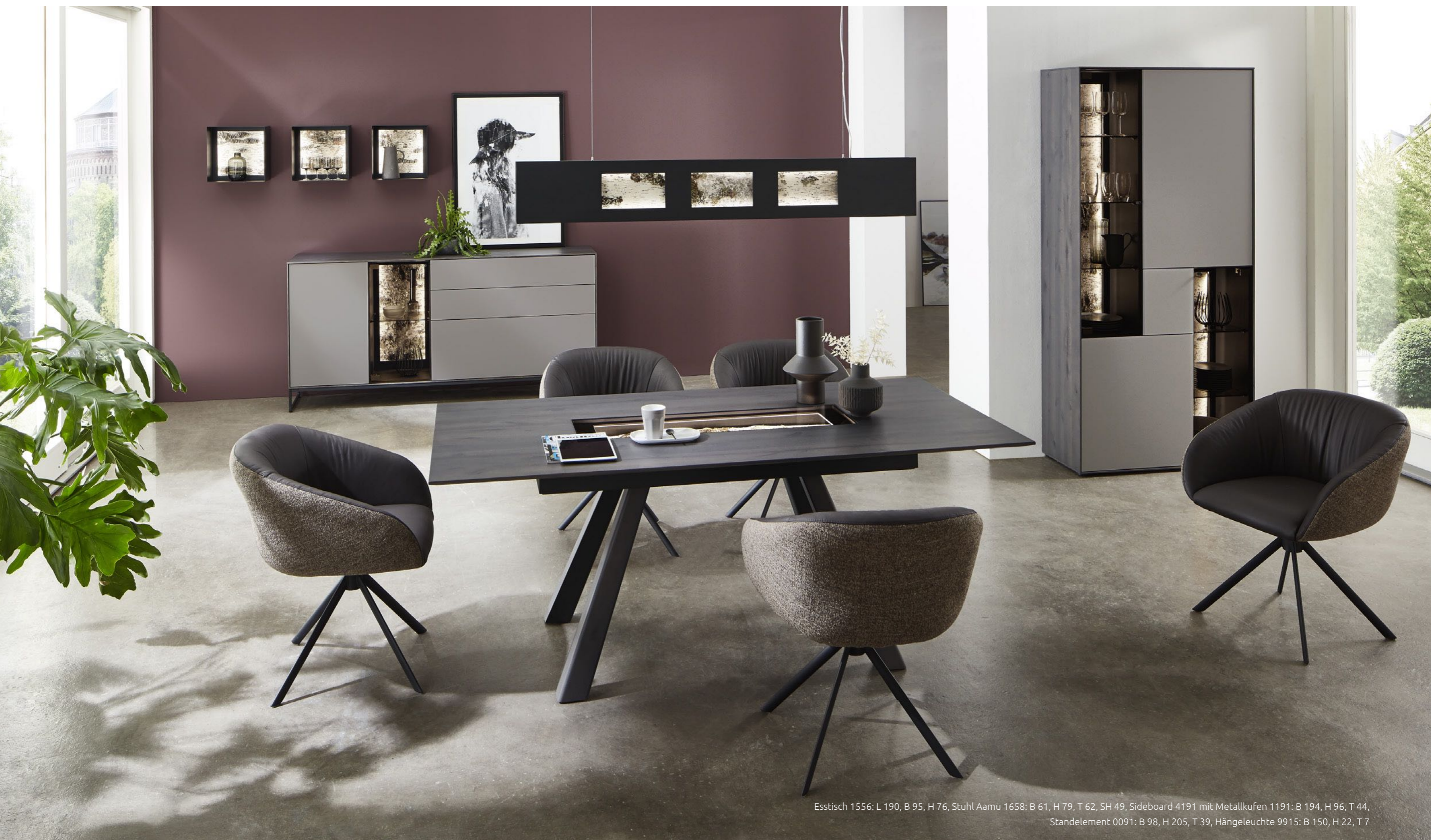
Esstisch 1556: L 190, B 95, H 76, Stuhl Aamu 1658: B 61, H 79, T 62, SH 49, Sideboard 4191 mit Metallkufen 1191: B 194, H 96, T 44, Standelement 0091: B 98, H 205, T 39, Hängeleuchte 9915: B 150, H 22, T 7