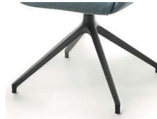
1016 Spinnenfuß drehbar schw. matt strukt. (gegen Aufpreis)