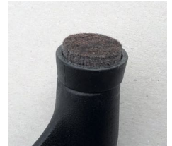
Filzgleiter (gegen Aufpreis)