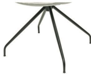
991 Spinnenfuß drehbar schwarz matt (gegen Aufpreis)