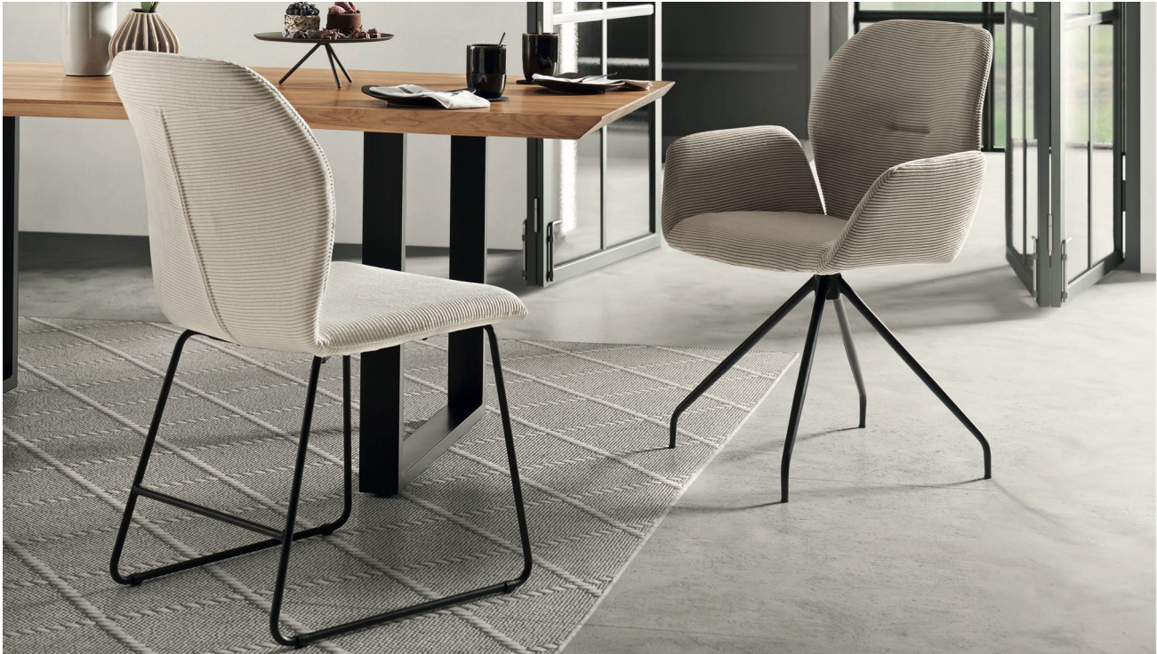
Stuhl und Armlehnenstuhl