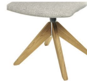
994 Spinnenholzfuß drehbar Eiche geölt (gegen Aufpreis)