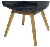
993 Holzgestell Eiche geölt (gegen Aufpreis)