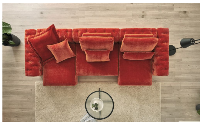
3x Basiselement + 2x Seitenelement medium + 3x Seitenelement