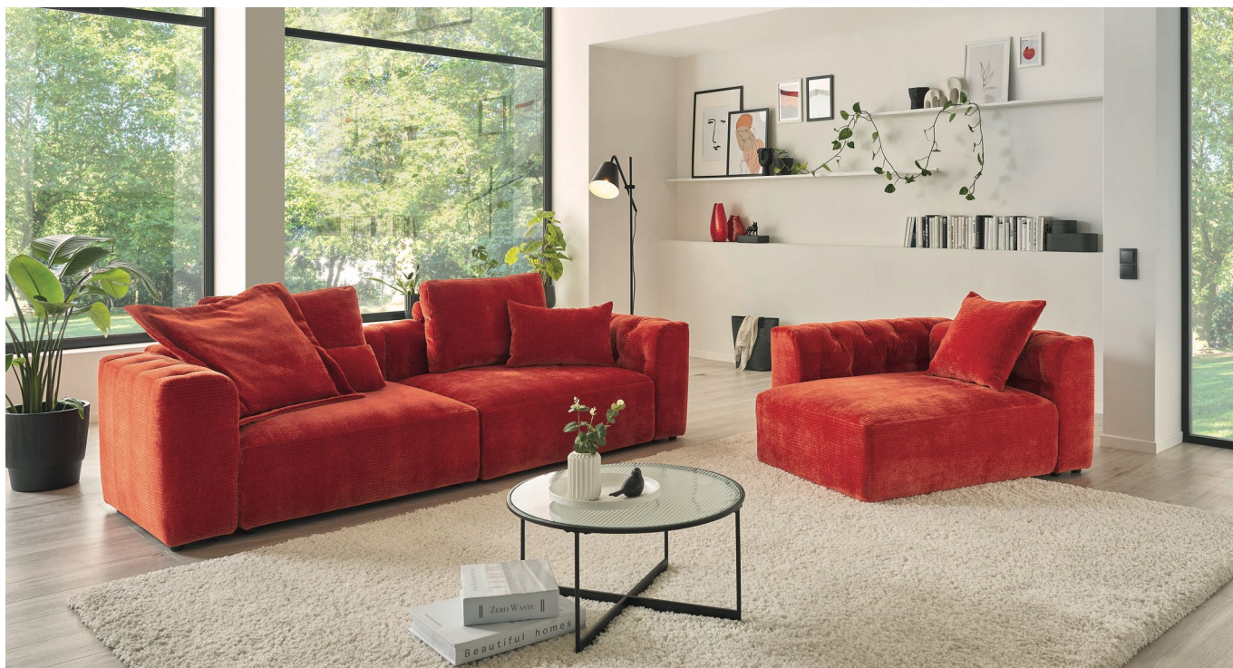
2x Basiselement + 2x Seitenelement medium + 2x Seitenelement / 1x Basiselement + 1x Seitenelement medium + 1x Seitenelement