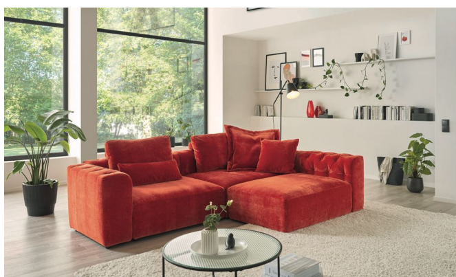
3x Basiselement + 3x Seitenelement medium + 2x Seitenelement